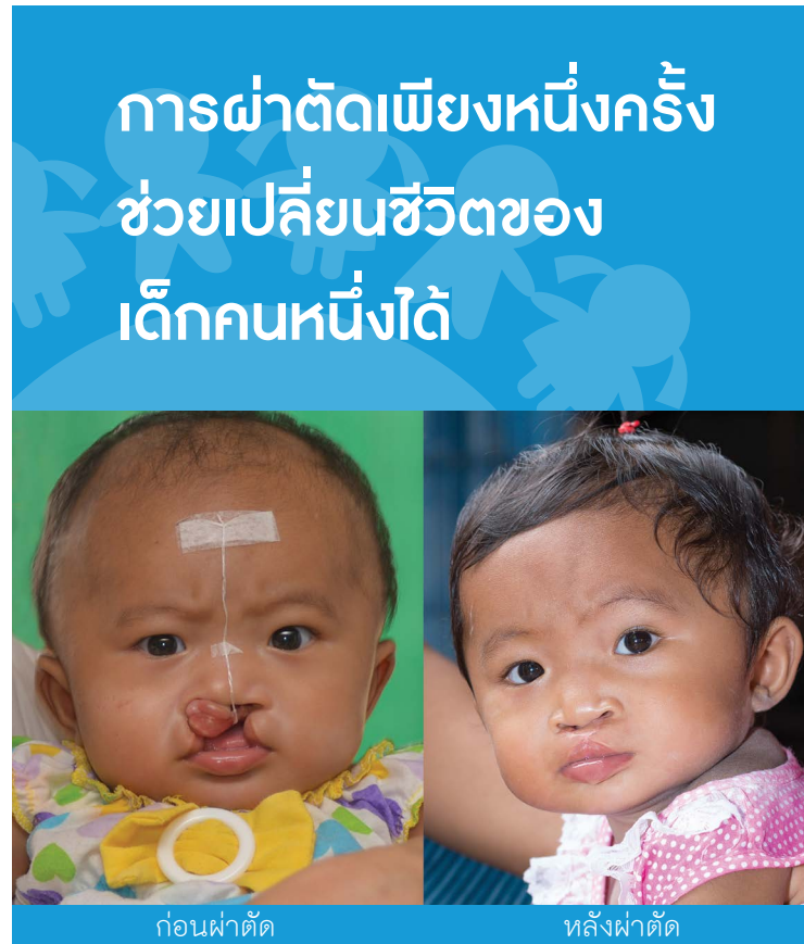
ก่อนผ่าตัด